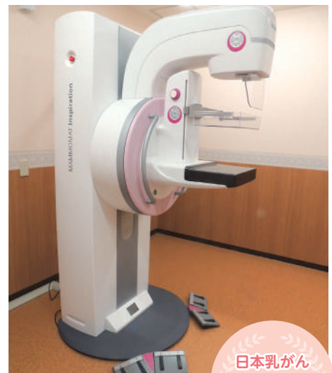
デジタル・マンモグラフィ