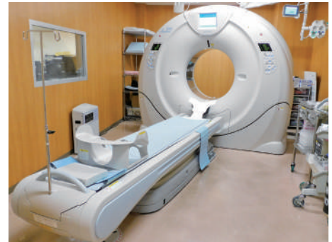
CT (320 列)