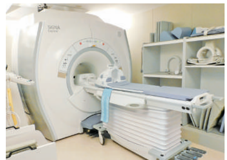
MRI (1.5 テスラ)